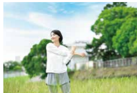
武庫川河川敷緑地(徒歩6分/約450m)

スタジオ名の「リーベ」はドイツ語で「愛」。私はバレエも生徒たちも、そして「仁川」も「リーベ=愛」しています。この街は歌劇で有名な「宝塚市」にあって、美しく洗練されたエリアの一角というイメージなので、レッスンを受ける生徒も品が良くて賢い子どもたちが多くいます。自然も豊かで子育てにも最適だと思います。