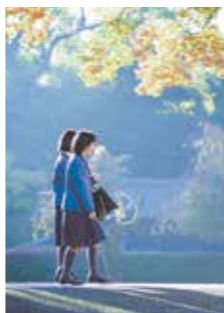
小林聖心女子学院