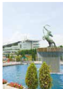
セントウルガーデン

「仁川」は大好きな「阪神競馬場」がすぐそこ。噴水のある「セントウルガーデン」や子どもと遊べる「スペースキッズ」があって、レースのない平日は無料で開放していたり、春には沿道の桜もキレイだし家族で楽しめます。レースのある日も競馬場のお客さんは地下道を使うなど動線が分けてあり近隣住民への配慮もされています。